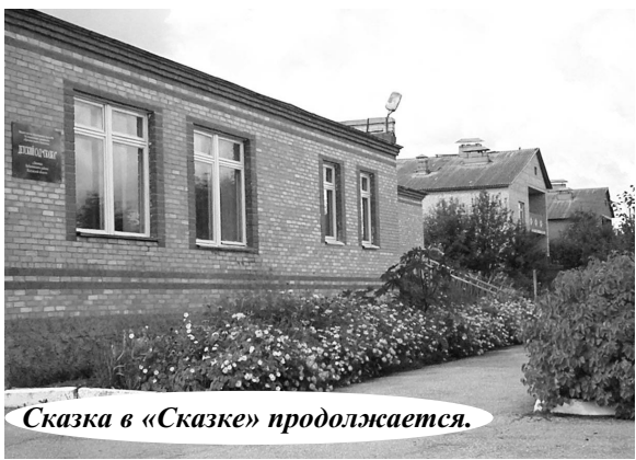
Сказка в «Сказке» продолжается.