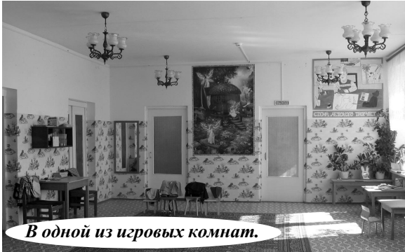
В одной из игровых комнат.

Много работы у коллектива и на территории сада-